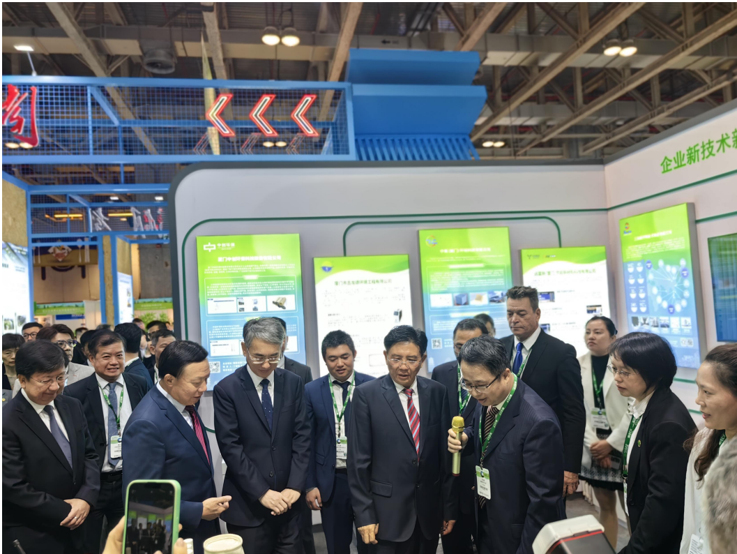
生态环境部党组书记孙金龙、中国环保产业协会会长郭承站等领导听取我司产品汇报。